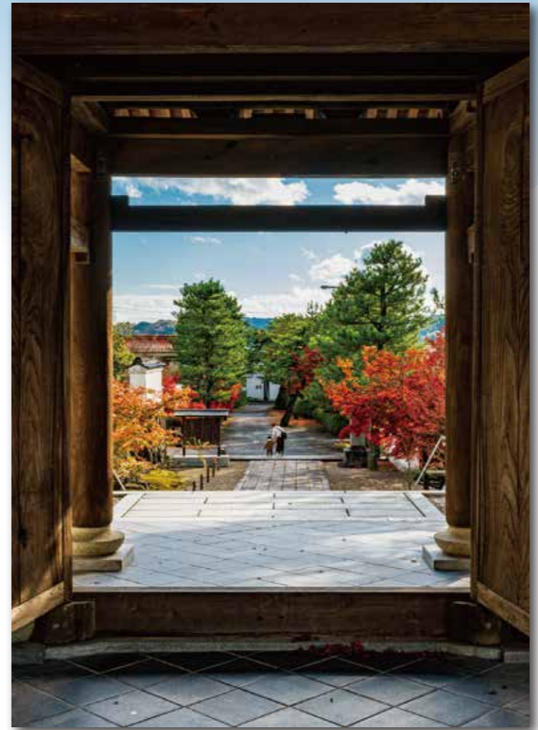
▲第4回大賞受賞作品