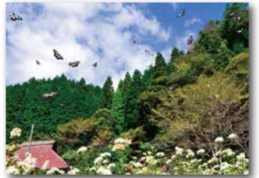
▲第4回 優秀賞受賞作品 ▼