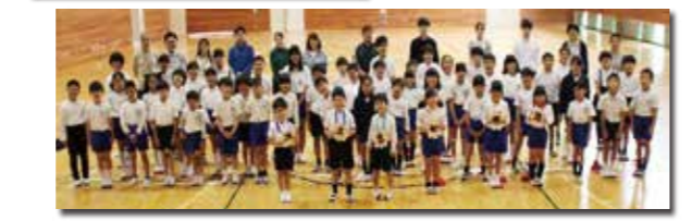
地域の皆さん、ありがとうございました