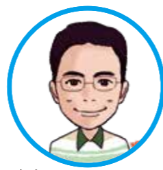
文責: 藤井塾主宰 藤井 隼介

速度の問題が苦手な小中学生は多いです。速度とは、単位時間当たりの進む距離…のことですが、そもそも単位時間とは?距離とは?何のことでしょうか。1時間は、太陽が昇ってから沈み、また昇ってくるまでを1日として、それを24等分したものです。これはとても分かりやすいですね。では距離、たとえばメートルはどうやって決まったのでしょうか?1800年ごろ、地球一周の長さを測り、それを元にして長さの単位を作ろうという会議が行われました。革命が起きていたフランスでのことです。できるだけ正確な測量で地球一周の長さを測り、それを4万分の1にしたものがキロメートル、さらに1000分の1にしたものがメートルです。今ではもっと厳密な方法で定められています。メートルを元に、リットルや、グラムといった単位もつくられました。ちなみに日本は昔から一尺、一寸といった長さの単位を使っています。今でも、大工さんは日本家屋を建てるときには一間、二間という測り方をしています。畳の大きさもそれで決まっているようです。ぜひ家の畳の長さを測ってみてください。