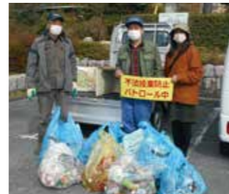
不法投棄パトロールを行いました (11月16日)