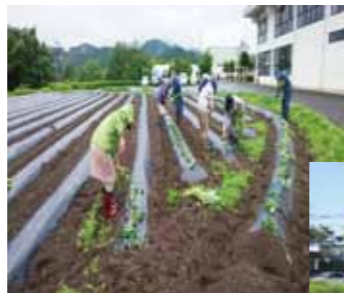
小雨の中、手際よく苗を植えました

そのためにも、一人ひとりが感染防止対策を徹底していきましょう。“コロナに負けるな”