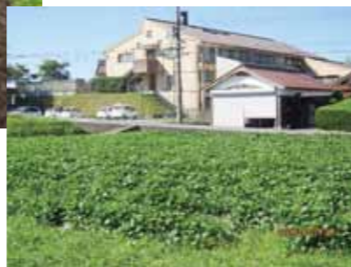
猛暑の中、元気に成長中